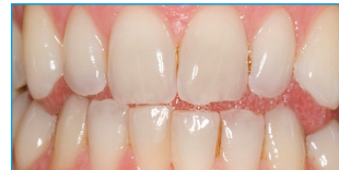
Vor Opalescence® PF