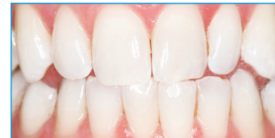
Nach Opalescence® PF