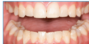
Vor Opalescence Go®