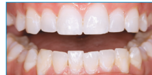
Nach Opalescence Go®